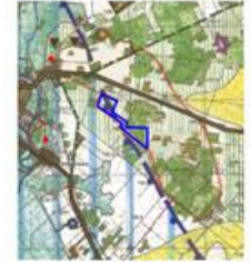
TERENY OBJĘTE OPACZNIEM

WYRYS ZE STUDIUM UWARUNKOWAŃ I KIERUNKÓW ZAGOSPODAROWANIA PRZESTRZENNEGO GMINY WĄSOSZ