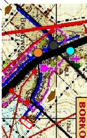
STREFY OBSZARÓW ZABUDOWY

Załącznik nr 1a do Uchwały nr XXV/109/12 Rady Gminy Kolno z dnia 31 sierpnia 2012r.