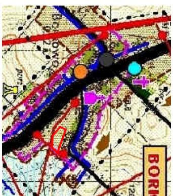
STREFY OBSZARÓW ZABUDOWY