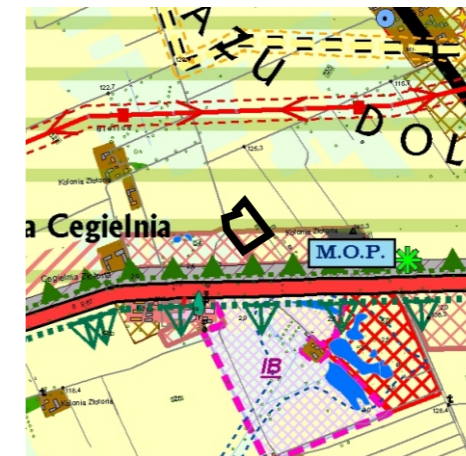
Kierunki zagospodarowania przestrzennego