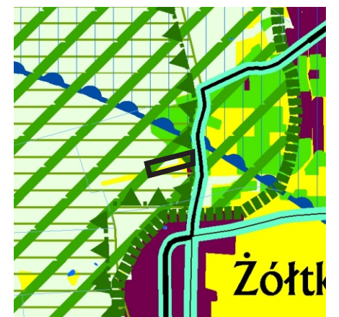
Kierunki kształtowania struktury przestrzennej obszarów funkcjonalnych

— granica obszaru objętego zmianą planu miejscowego