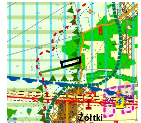
Kierunki zagospodarowania przestrzennego