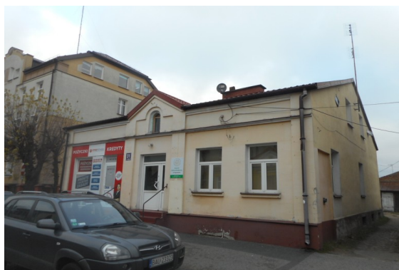
c) ul. 3 Maja 30 – 6 lokali mieszkalnych – sprzedaż,