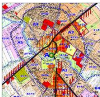
TEREN OBJĘTY ZMIANĄ PLANU

WYRYS ZE STUDIUM UWARUNKWAŃ I KIERUNKÓW ZAGOSPODAROWANIA PRZESTRZENNEGO MIASTA ZAMBRÓW Uchwała Nr 50/XIII/11 Rady Miejskiej w Zambrówie z dnia 25 października 2011 roku (z póź. zm.)