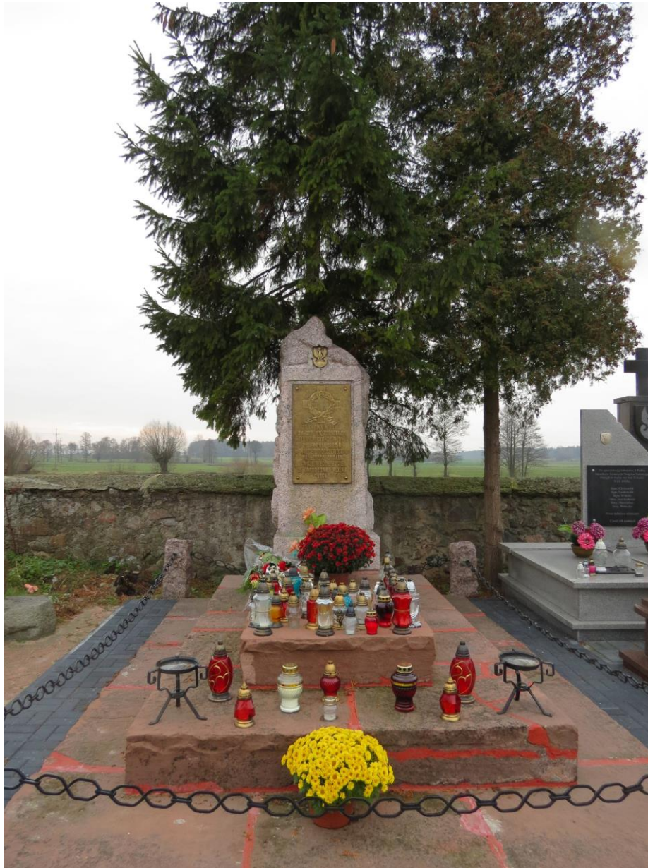
Śniadowo, cmentarz parafialny. Mogiła zbiorowa 26 nieznanych żołnierzy polskich poległych w walkach w sierpniu 1920 r.