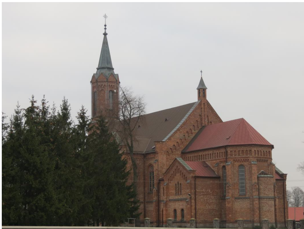
Kościół parafialny w Śniadowie

Romanowskiego przeprowadzono remont pokrycia dachowego, a wewnątrz dokonano malowania i wystroju kościoła według projektu Zbigniewa Łoskota. Staraniem ks. prob. Zbigniewa Gołubowskiego w latach 1980-2000 zostały przeprowadzone gruntowne prace remontowe wewnątrz i zewnątrz kościoła łącznie z wymianą dachu i nowym wystrojem prezbiterium.