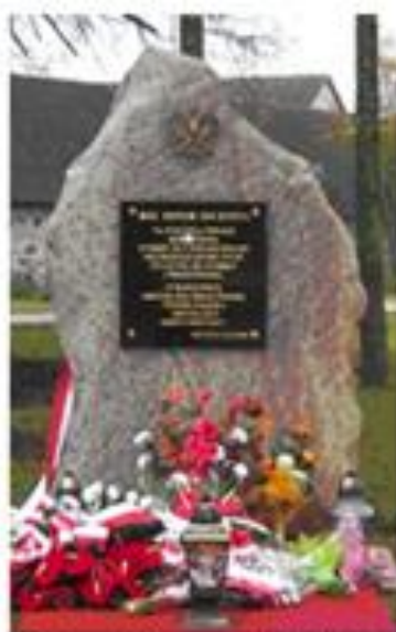
Pomnik upamiętniający 90 rocznicę odzyskania przez Polskę Niepodległości