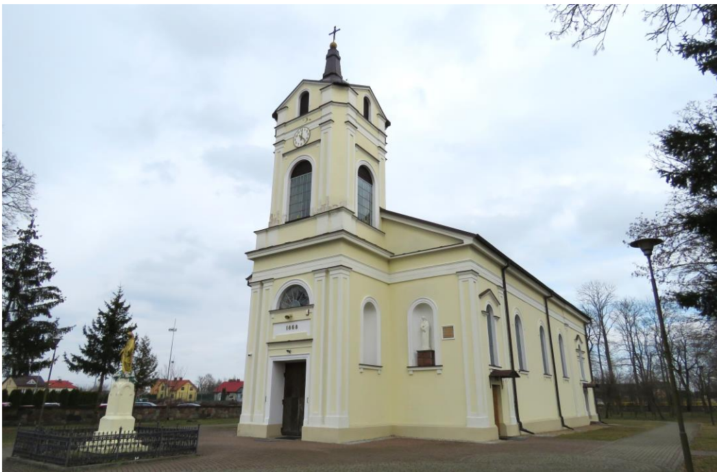
Kościół parafialny p.w. św. Szymona i Judy w Jabłoni Kościelnej