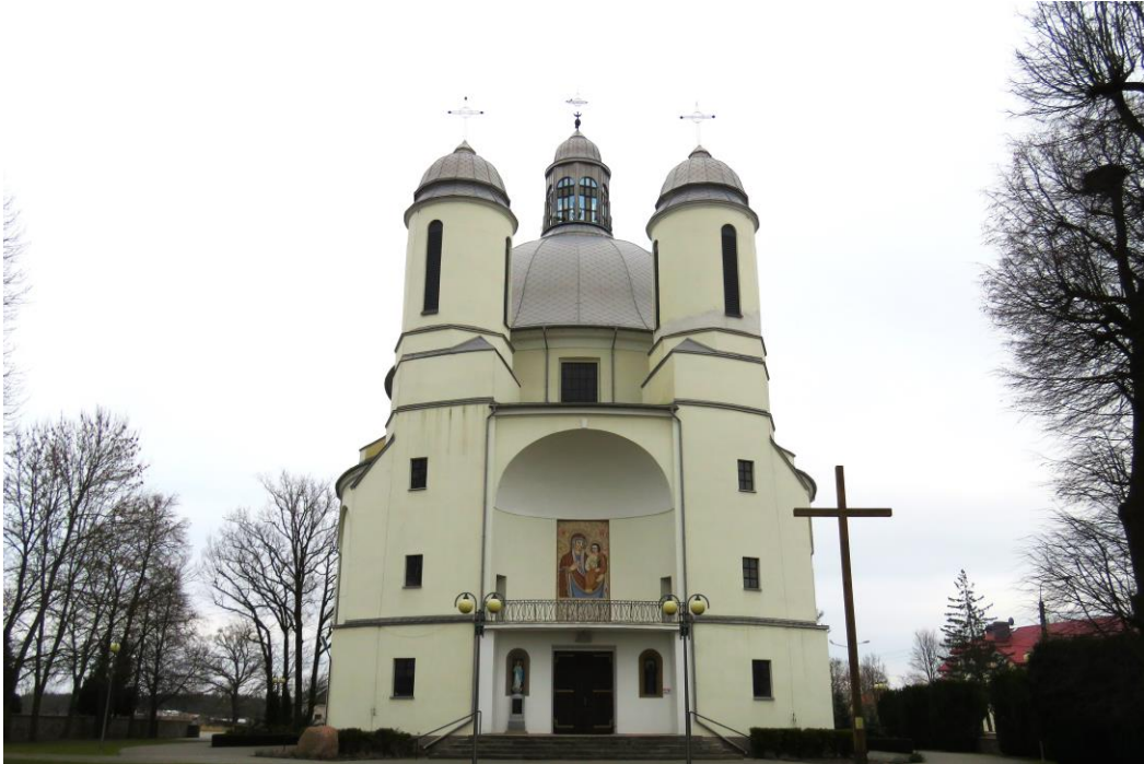
Kościół parafialny p.w. Wniebowzięcia NMP w Hodyszewie